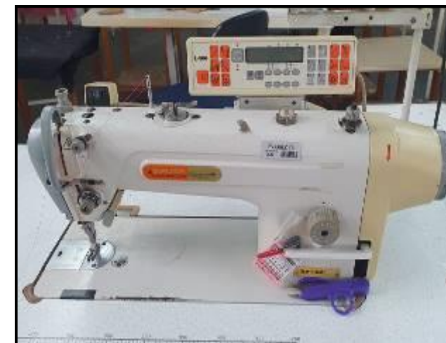
Item 18: Máquina Reta Siruba DL918