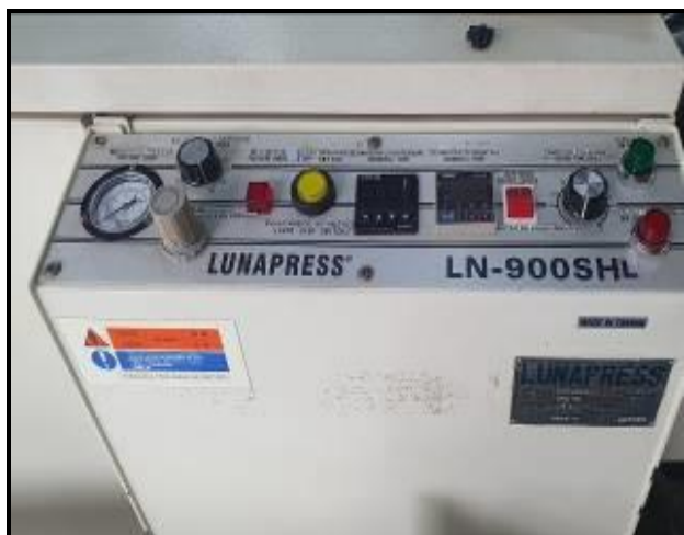
Item 66: Máquina Fusionar tecido Largura 50 cm LUNAPRESS LN900/7L