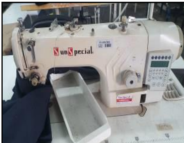
Item 19: Máquina Reta Sun Special SS9988HR-D4