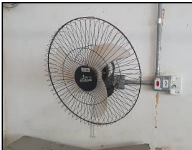
Item 31: Ventiladores Oscilante