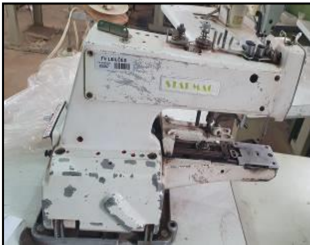
Item 57: Máquina de costura Starmaq 35