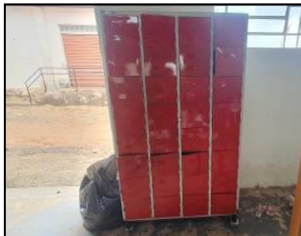
Item 38: Roupeiro 32 Vãos Vermelho