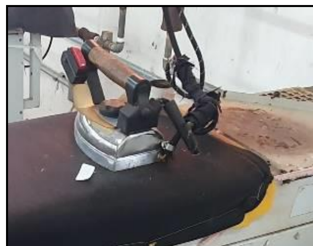
Item 89: Ferro Rodonti Modelo EC 11 c/ sapatas