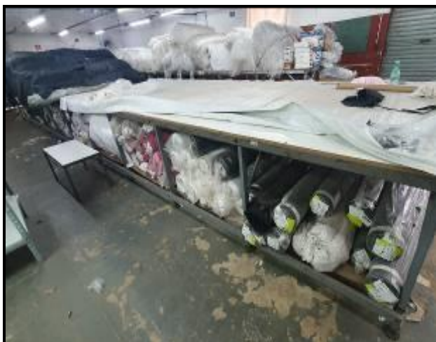
Item 74: Mesa de corte 13 mts