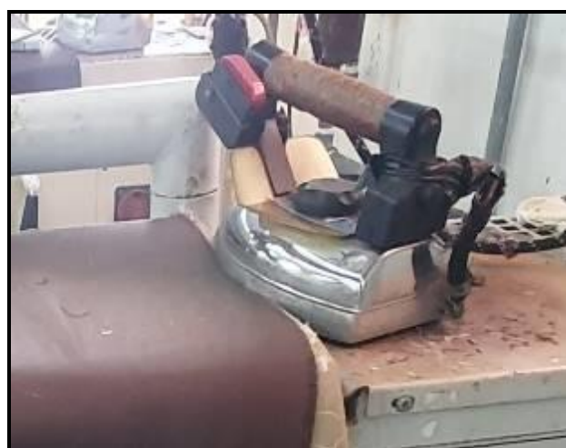
Item 87: Ferro Rodonti Modelo EC 11 c/ sapatas