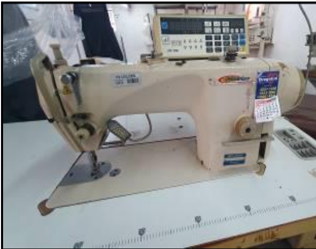
Item 15: Máquina Reta Holden WP-8900