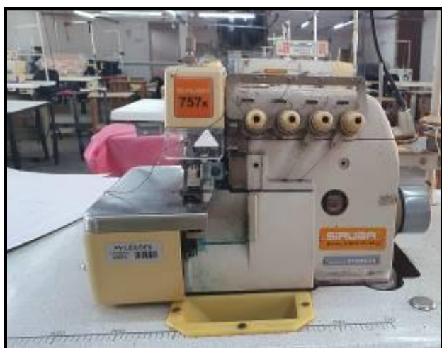
Item 11: Máquina Siruba Overlock ponto cadeia 4 fios