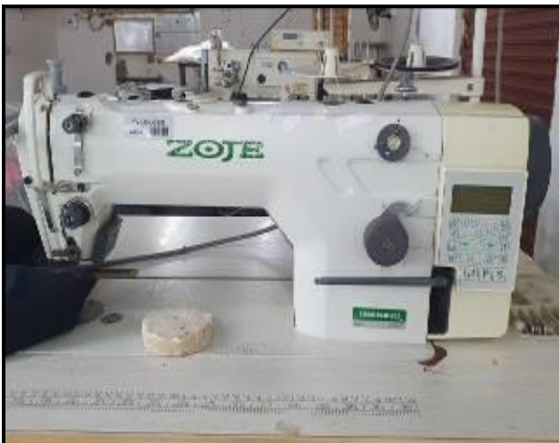
Item 27: Máquina Costura ZOJE ZJ 9703