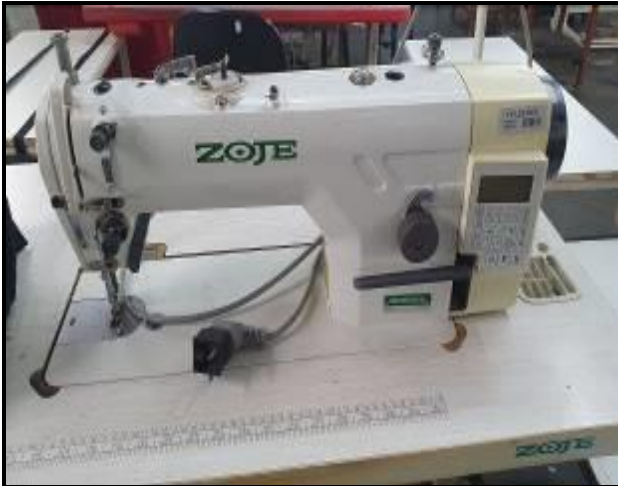
Item 13: Máquina Costura ZOJE ZJ 9703