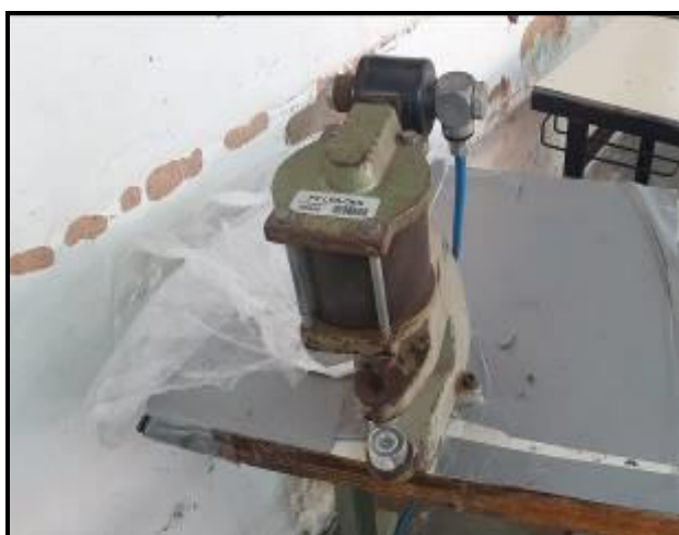
Item 33: Máquina de Pregar botão pressão