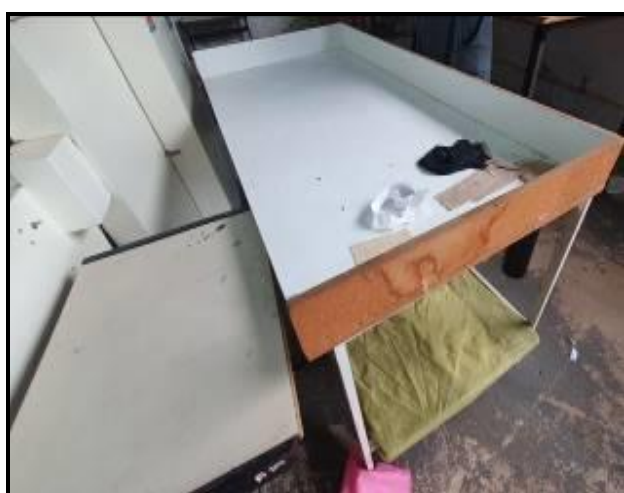
Item 68: Mesas de corte de Linha 1,50m x 0,75m