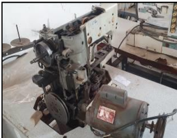
Item 43: Máquina Travete Brother (incompleta)