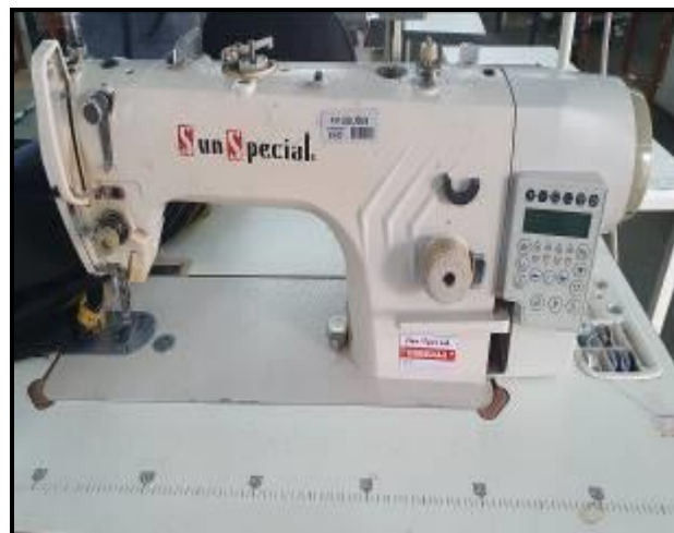
Item 17: Máquina Reta Sun Special SS9988HR-D4