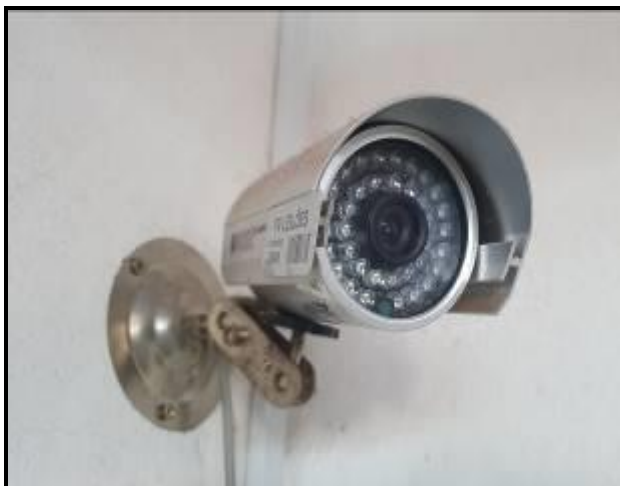
Item 37: Câmeras de monitoramento (desligado)