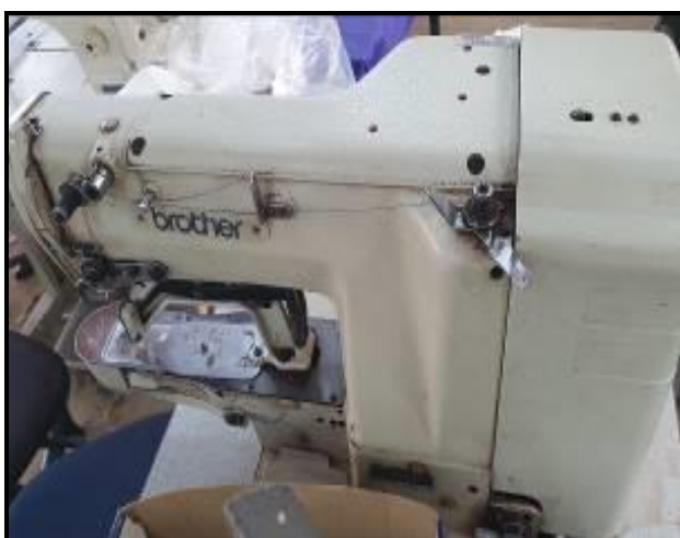
Item 59: Máquina Travete Brother LK3B430-2