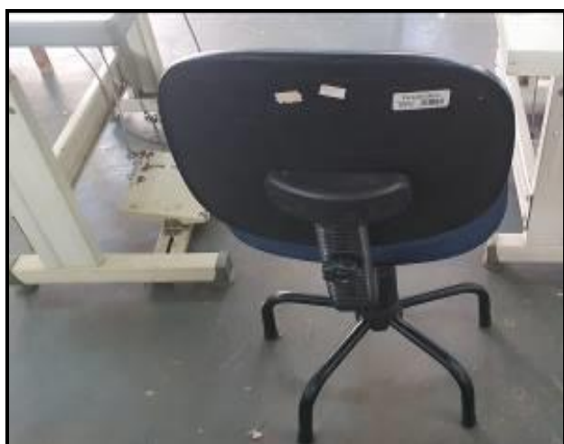
Item 9: Cadeiras Ergonômicas