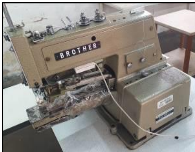
Item 7: Botoneira BROTHER C83-B913-1