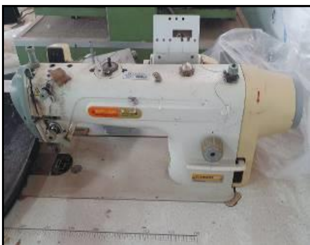
Item 63: Máquina Reta Siruba DL918