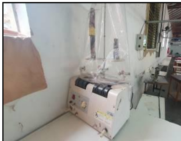
Item 32: Rebobinadeira