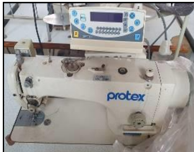
Item 50: Maquinas Reta Protex TY7100C-403/AH