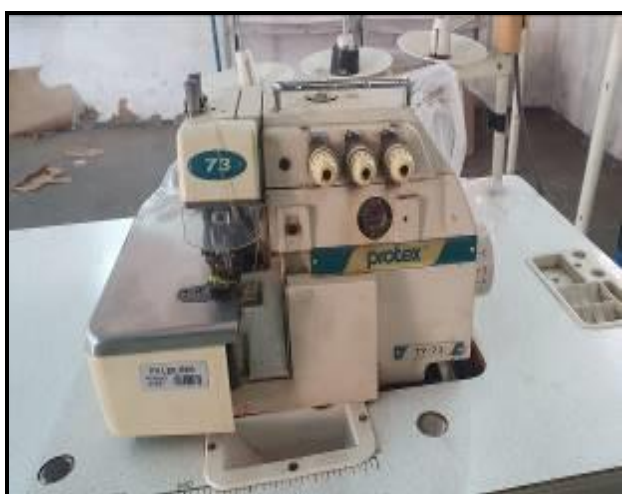
Item 5: Máquina Overloque Protex 3 fios