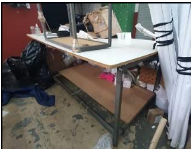
Item 78: Mesa Auxiliar 3,50m x 2m