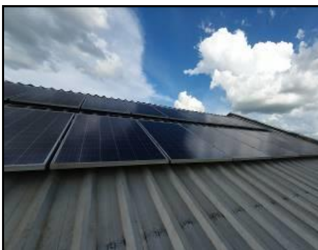
Item 80: Gerador Fotovoltaico (Encontra-se no endereço: Rua Vicinal José Bocardi, Sítio Santa Izabel – Adamantina - SP)