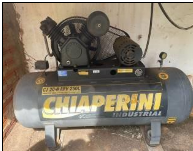
Item 83: Compressor Chiaperini Mod CJ 20 APV 250