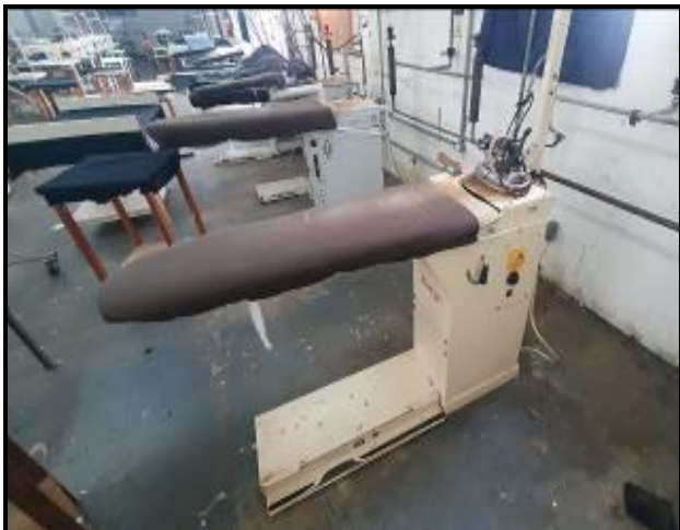
Item 3: Banca de Passar Roupa