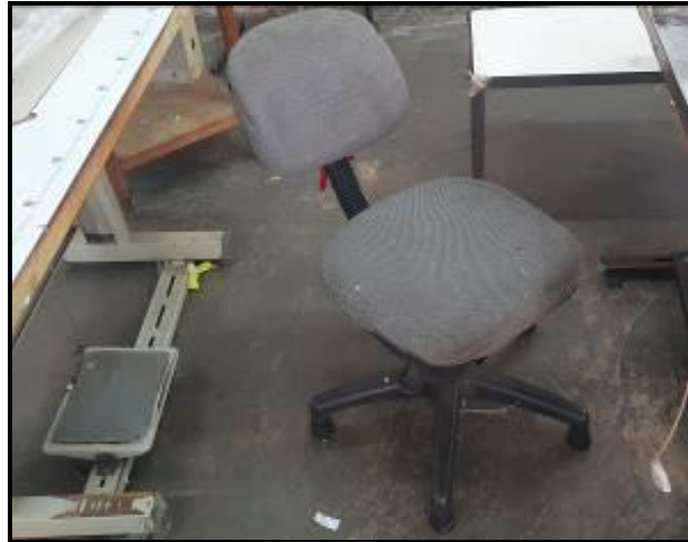
Item 90: Cadeiras Costureira Zeus