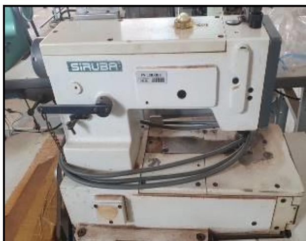
Item 48: Máquina Galoneira Siruba com trançador