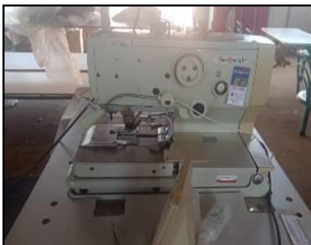
Item 65: Caseadeira de Olho Sun Special SS9820-01W