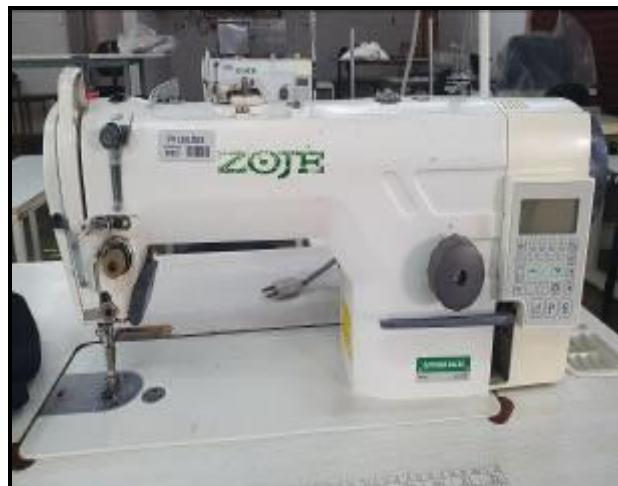
Item 20: Máquina Costura ZOJE ZJ 9703