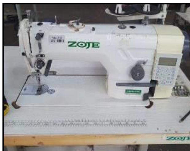
Item 22: Máquina Costura ZOJE ZJ 9703