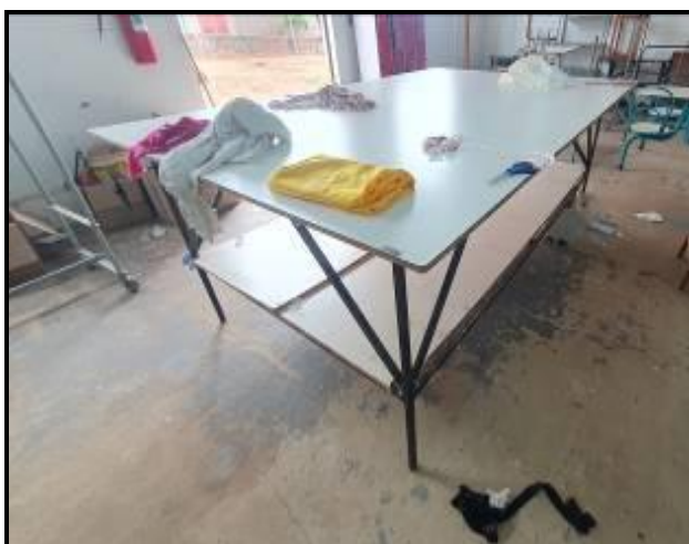
Item 67: Mesa de separação 1,30m x 2,20m