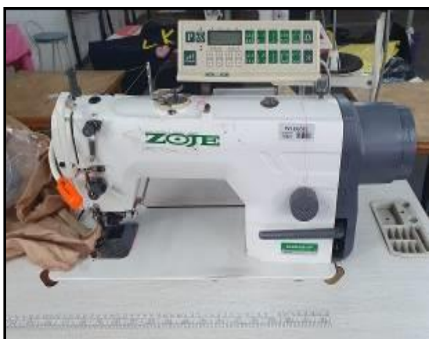
Item 21: Máquina Costura El c refilador Zoje ZY5030R-D2B/01