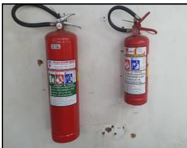
Item 36: Extintores