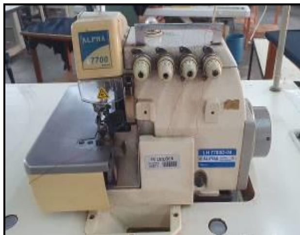
Item 8: Máquina Alfa Overlocke 4 fios LH7700D-04