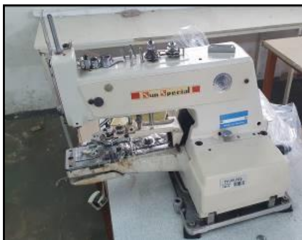
Item 12: Botoneira Sun Special