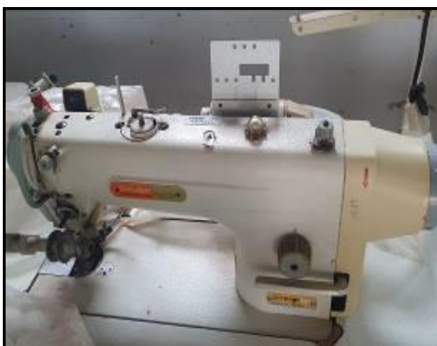
Item 51: Maquina Reta Siruba DL918