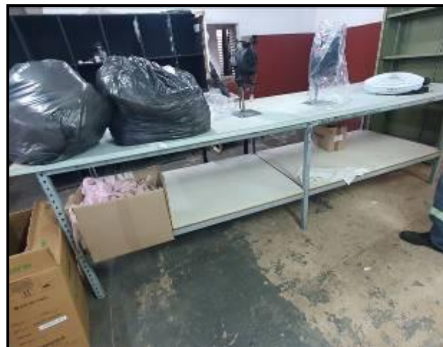
Item 73: Mesa de separação 4,00m x 1,00m