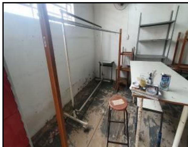
Item 40: Arara de Roupa Média