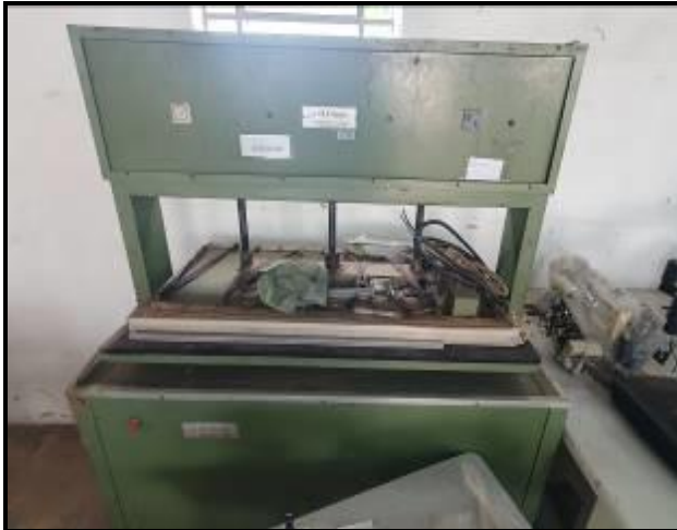
Item 55: Fusionadeira H. Picolli verde