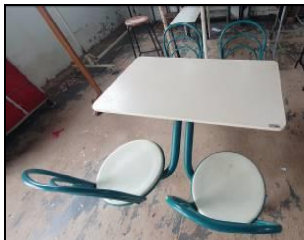
Item 42: Mesa de refeitório com 4 acentos