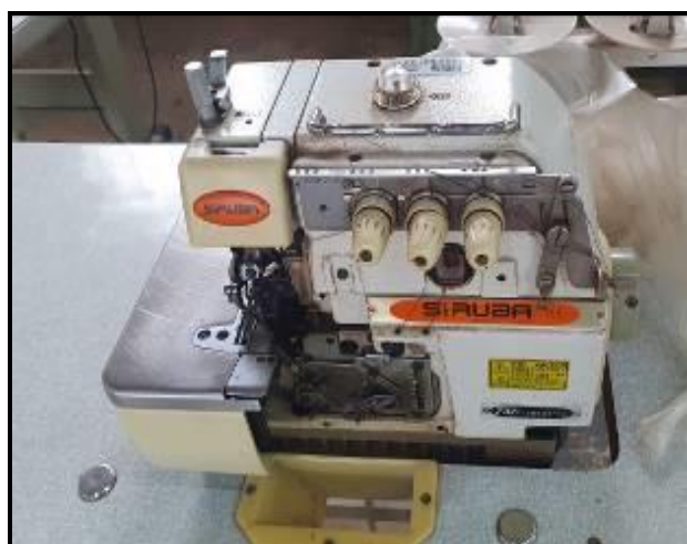
Item 47: Máquina Overloque Siruba 737F