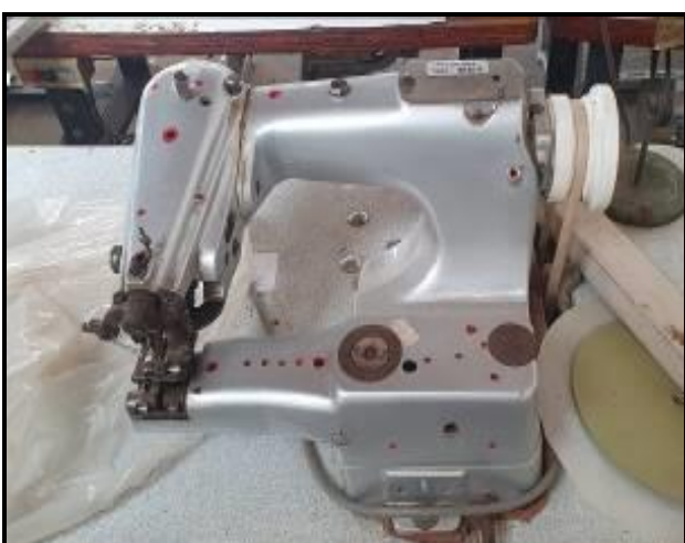
Item 53: Máquina barra invisível Lewis