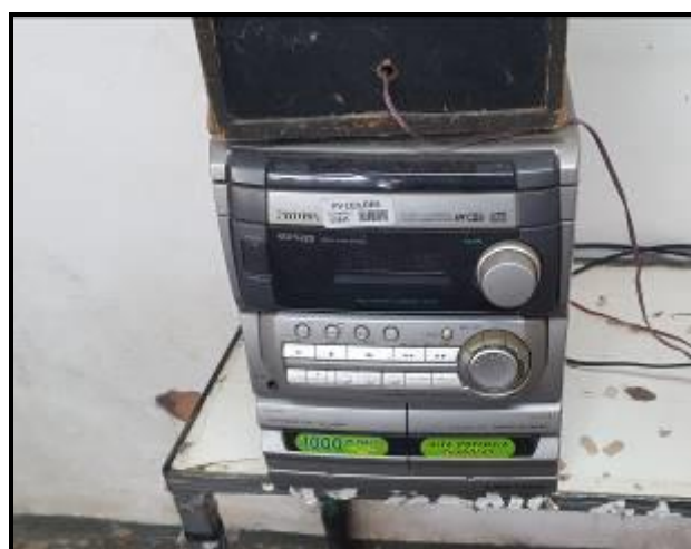
Item 35: Microsystem Aiwa 1000w