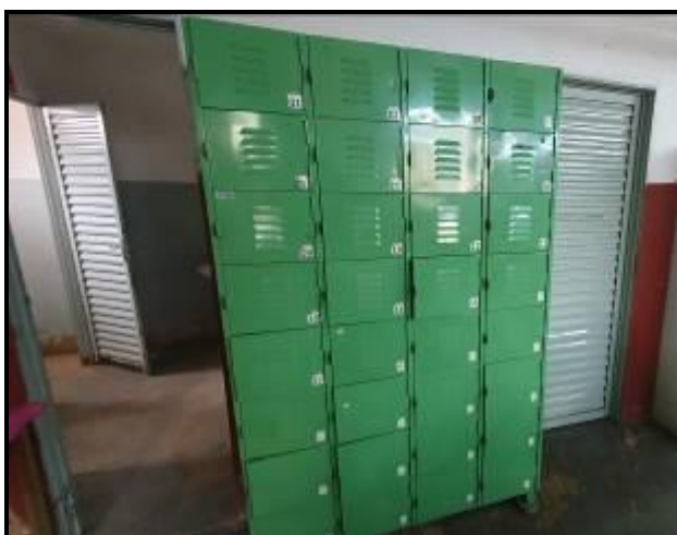
Item 76: Roupeiro de aço 32 portas verde