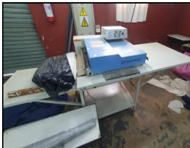
Item 79: Fuzionadeira EUROTECH SR600