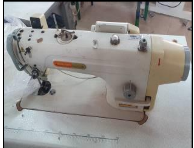
Item 56: Máquina Reta Siruba DL918