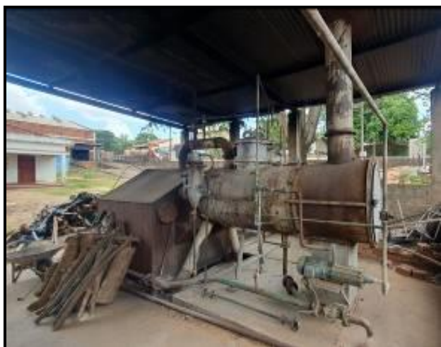
Item 4: Caldeira Tubular FUBRAM NUMERO 0188 com reservatório de água aprox. 2 mil litros.