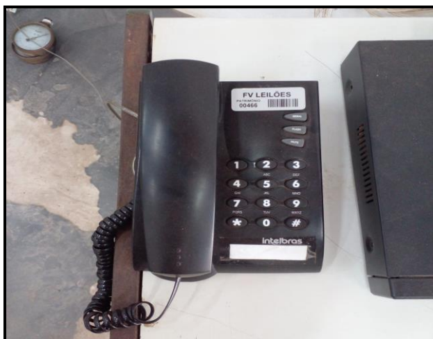
Item 1: Aparelho telefônico