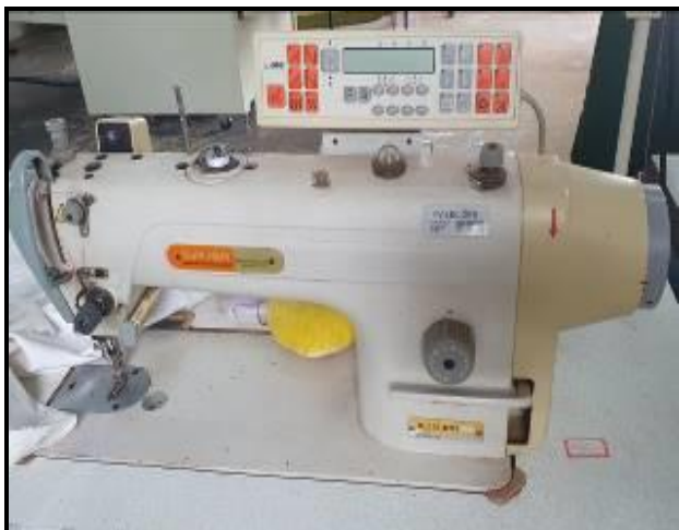
Item 61: Máquina Reta Siruba DL918