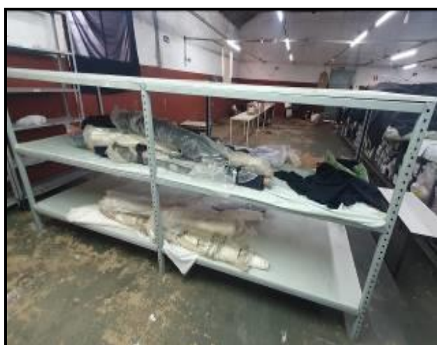
Item 70: Estante de Ferro 4m x 1,20m