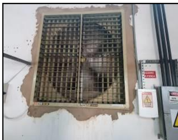
Item 34: Ventilador evaporativo R160F FB MOD 600