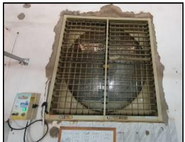
Item 30: Ventilador Evaporativo R 160 FB MOD 600