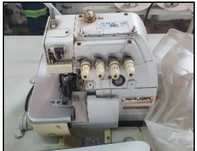
Item 58: Máquina Siruba Interloque mecânica 5 fios 516M2-