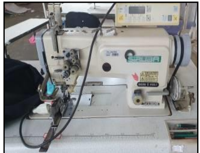
Item 28: Máquina Reta Siruba de Bolso T828-42-127KL/C