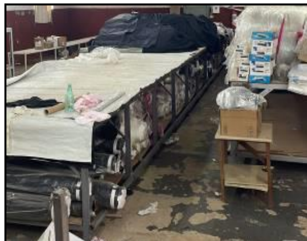
Item 75: Mesa de corte 13 mts