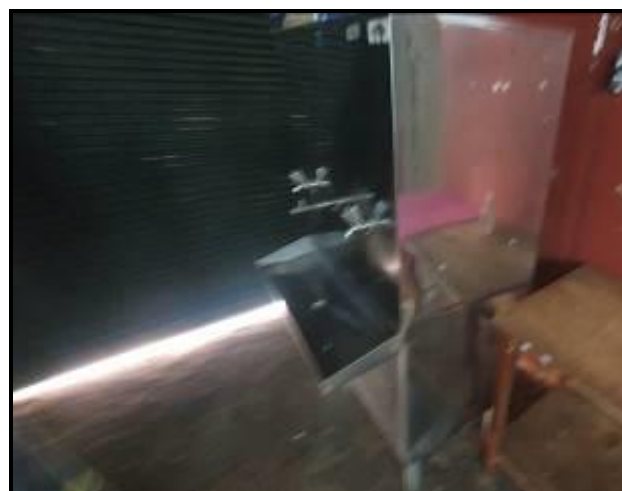
Item 77: Torre Resfriadora de água inox 100 litros