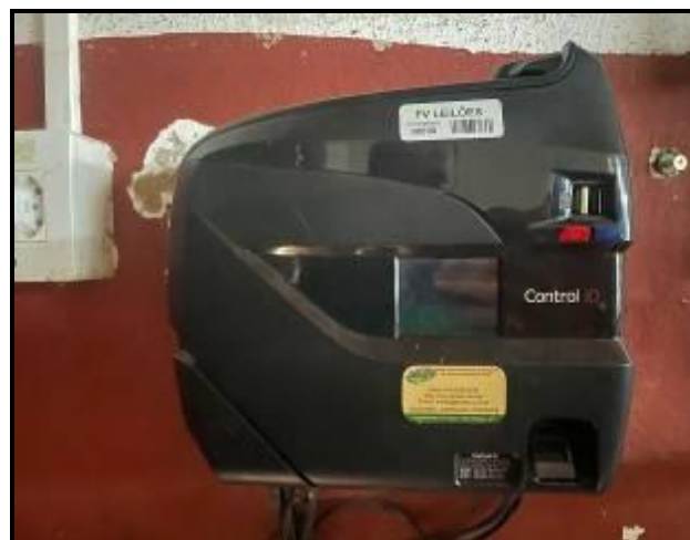
Item 84: Relógio de Ponto REP IDCLASS