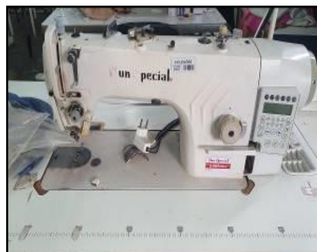
Item 24: Máquina Reta Sun Special SS9988HR-D4