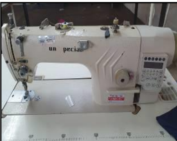
Item 29: Máquina Reta Sun Special SS9988HR-D4