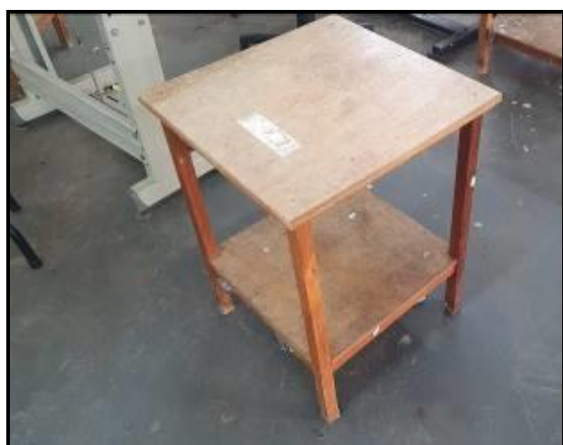
Item 85: Mesa Auxiliar 2,5m