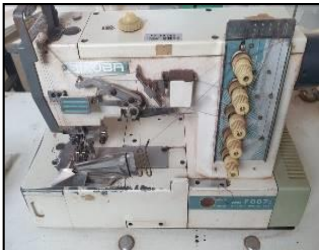
Item 49: Maquina Galoneira Siruba com trançador