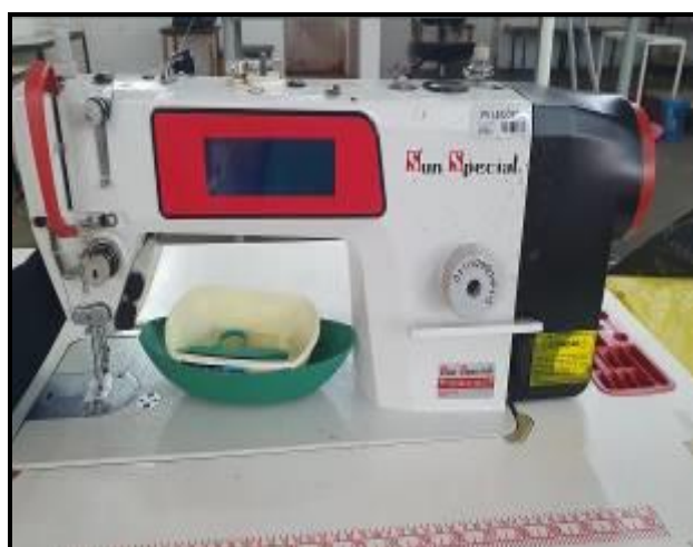
Item 23: Máquina Reta Sun Special SS9300M-D4