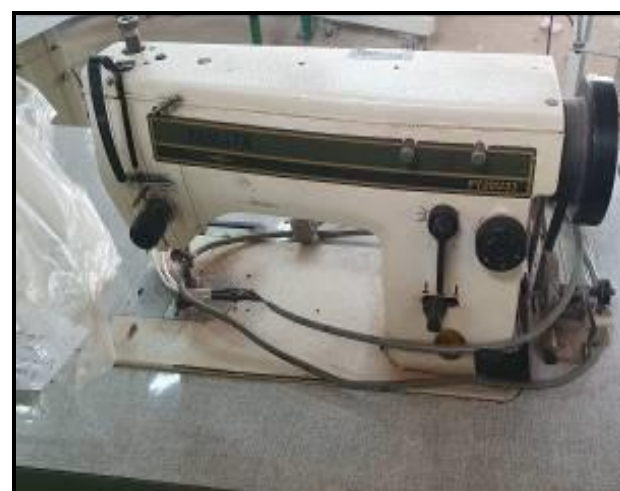
Item 54: Máquina de costura reta Yamata FY20U33