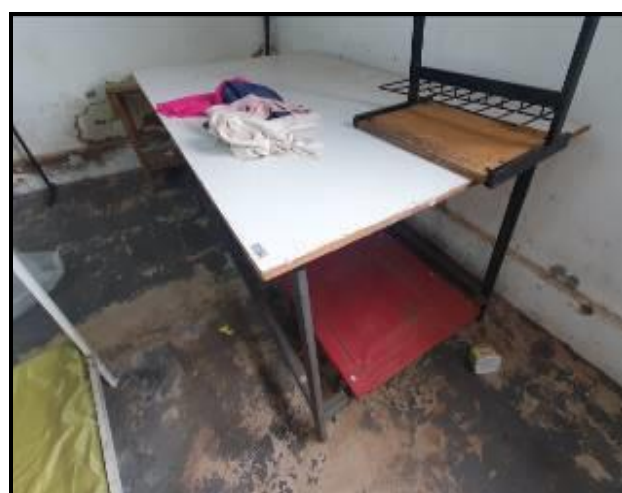
Item 69: Mesa Corte de Linha 1,00m x 0,80m