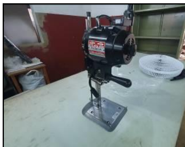
Item 71: Máquina Corte Sun Special 850W SSBHL