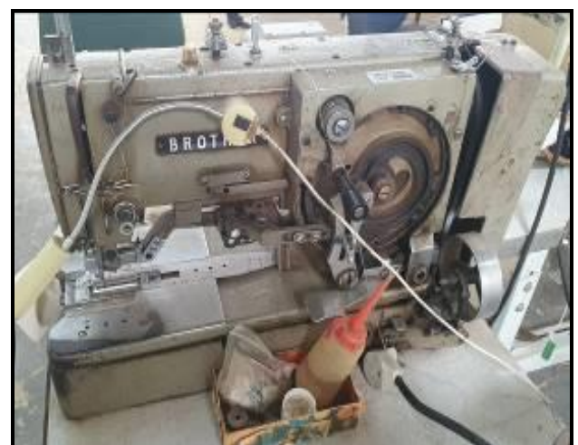
Item 60: Máquina Caseadeira Brother Reto