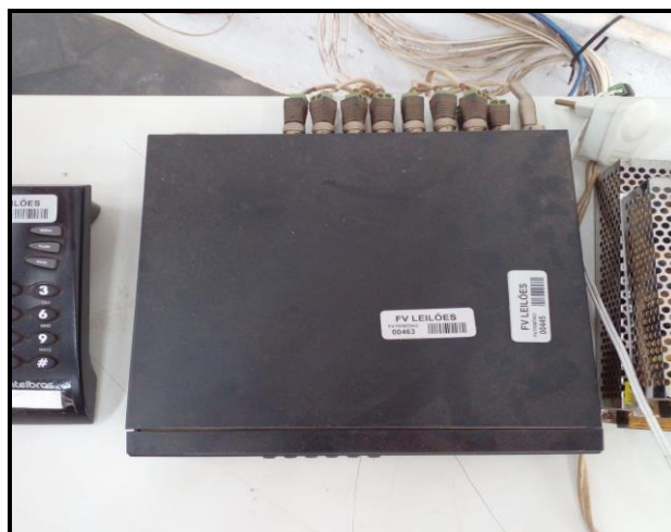
Item 2: Sistema monitoramento (desligado)