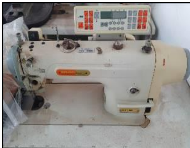
Item 62: Máquina Reta Siruba DL918