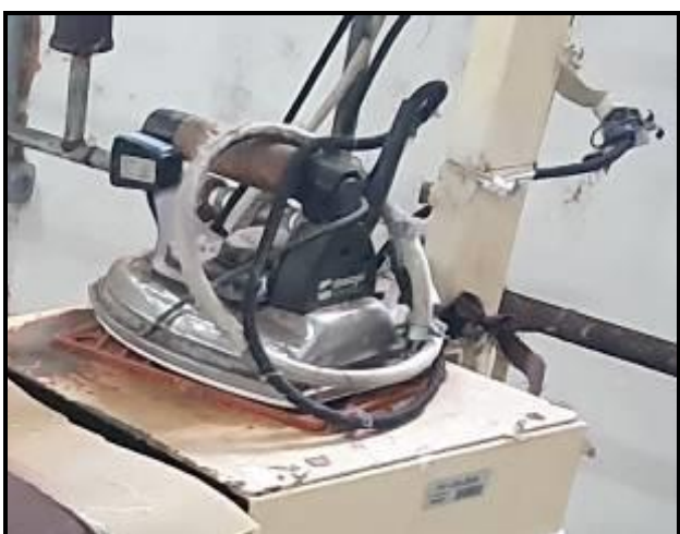
Item 88: Ferro Rodonti Modelo EC 11 c/ sapatas