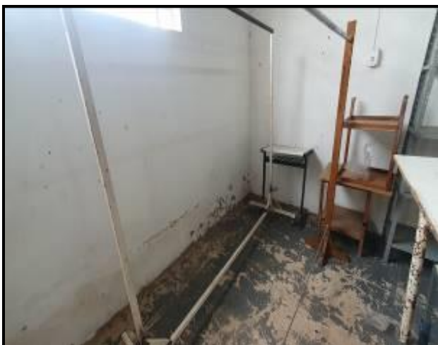
Item 39: Arara de roupa Grande