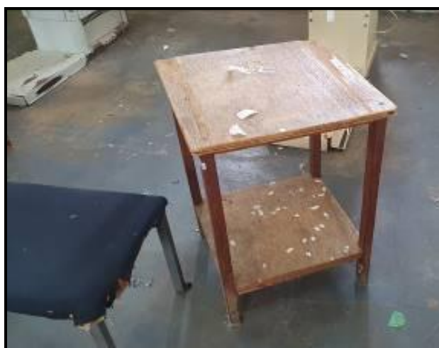
Item 10: Banquetas auxiliares