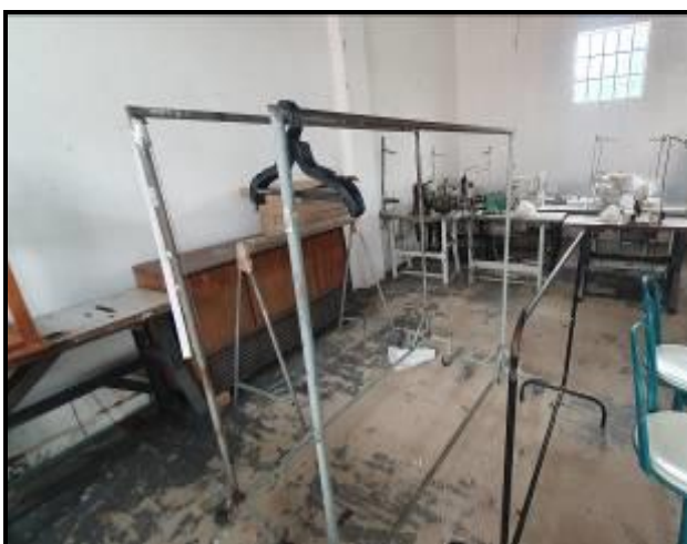
Item 41: Arara de roupa Pequena