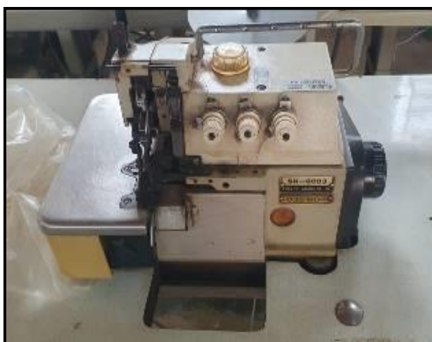
Item 45: Overloque 3 fios SH6003