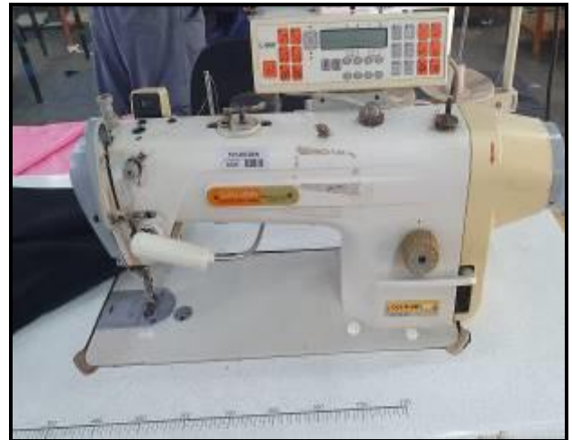
Item 16: Máquina Reta Siruba DL918