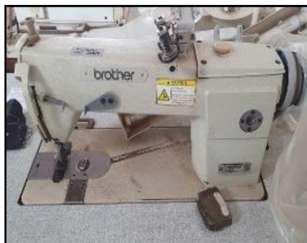
Item 52: Máquina de costura Brother ponto B962