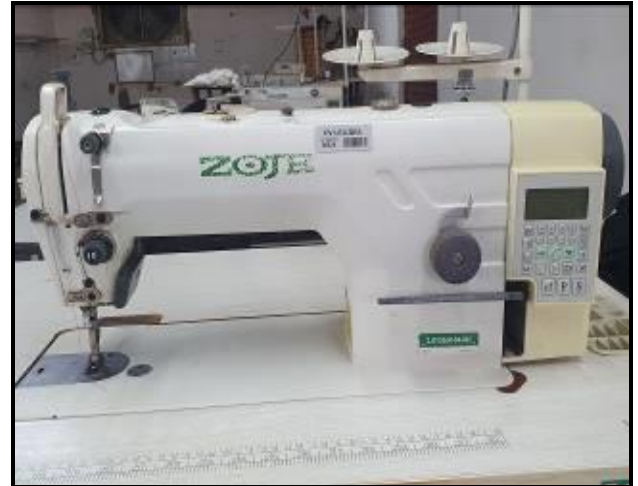
Item 26: Máquina Costura ZOJE ZJ 9703