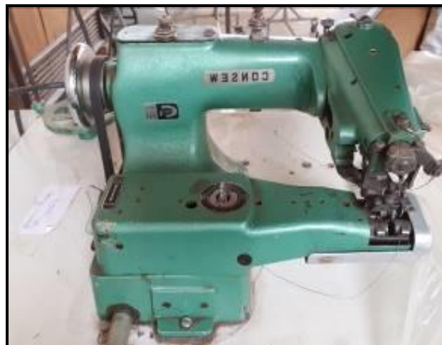
Item 44: Barra invisível Consew