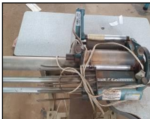
Item 46: Máquina de Cortar viés