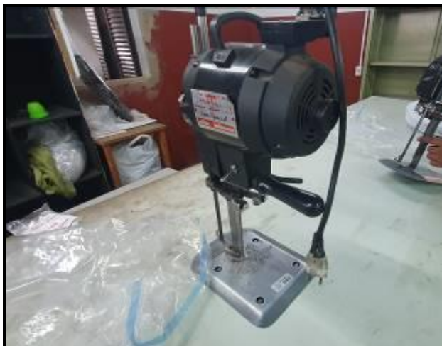
Item 72: Máquina Corte Sun Special 8 pol Preta 750W CVD3A