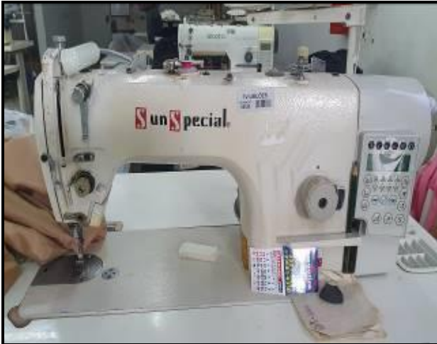
Item 25: Máquina Reta Sun Special SS9988HR-D4