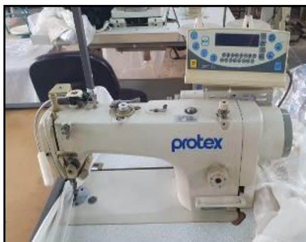
Item 64: Máquinas Reta Protex TY7100C-403/AH