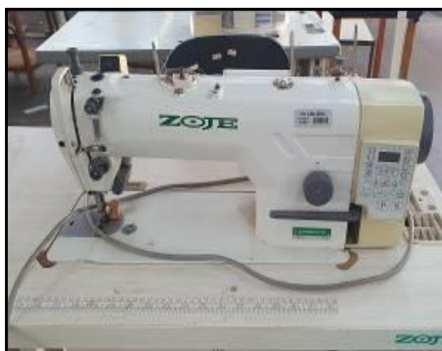
Item 6: Máquina Reta Zoje ZY9703-ARD3