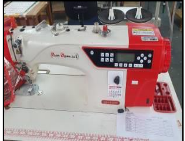
Item 14: Máquina Costura Reta Sun Special SS18ED4-PR