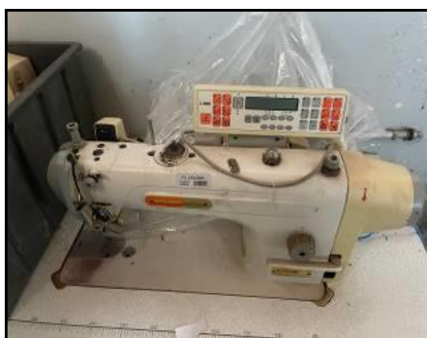
Item 82: Máquina Reta Siruba DL918