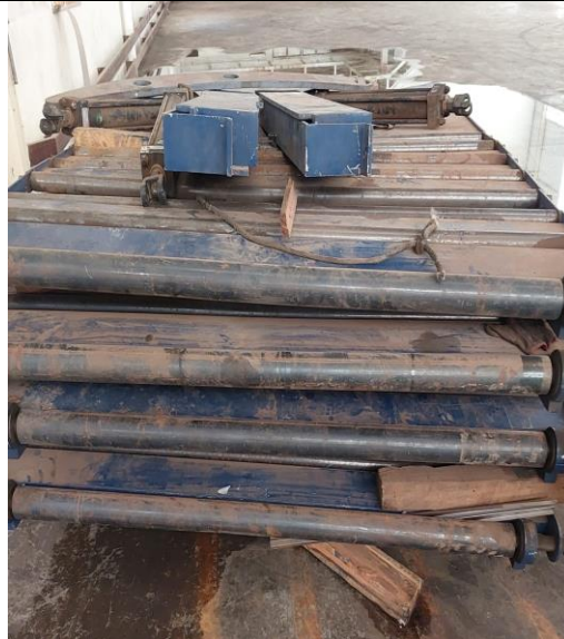
MÁQUINA: MESA DE ALINHAMENTO – OBS.: FALTANDO PARTE ELÉTRICA.