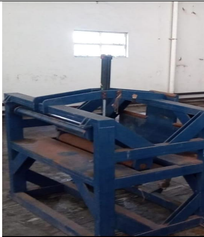
MÁQUINA: COMPACTADOS DE CHAPA – OBS.: FALTANDO ACIONAMENTO MECÂNICO, HIDRÁULICO E ELÉTRICO.