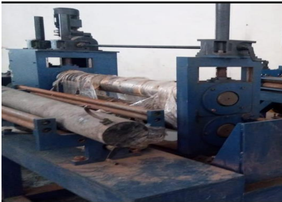
MÁQUINA: CÍLINDRO DE CORTE – OBS.: FALTANDO AS FACAS, O ACIONAMENTO MECÂNICO E PARTE ELÉTRICA.