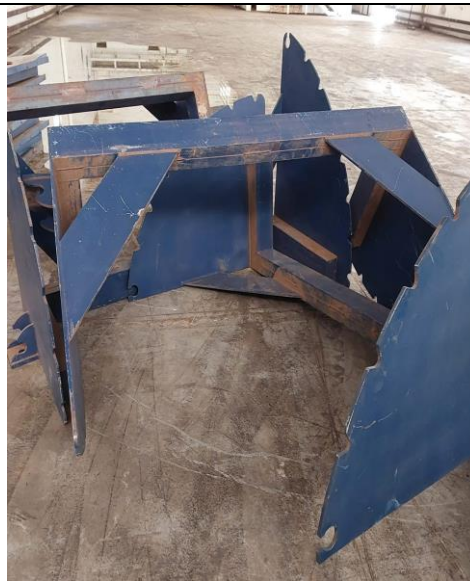
MÁQUINA: PARTES DA ESTRUTURA INCOMPLETA.