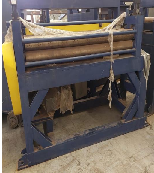
MÁQUINA: GUILHOTINA DE CHAPA - OBS.: FALTANDO ACIONAMENTO HIDRÁULICO, MECÂNICO E ELÉTRICO.