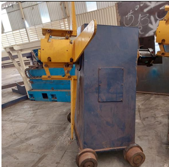
MÁQUINA: DESEMBOBINADOR – OBS.: FALTANDO PARTE ELÉTRICA E ALINHAMENTO.