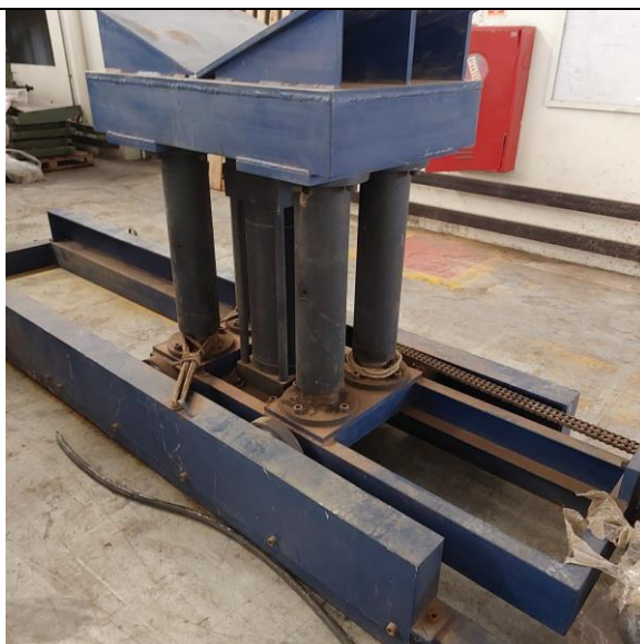
MÁQUINA: SUPORTE DE BOBINA – OBS.: FALTANDO PARTE ELÉTRICA E ALINHAMENTO.