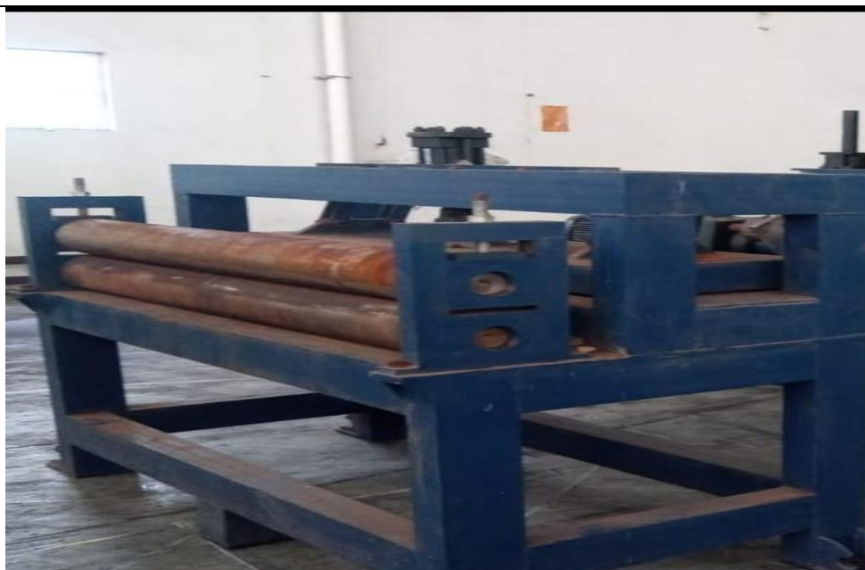
MÁQUINA: ALINHADOR E CALANDRA – OBS.: FALTANDO ACIONAMENTO MECÂNICO, PARTE ELÉTRICA E ALINHAMENTO.